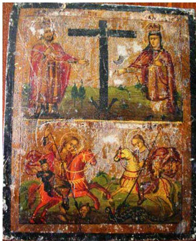
Сл.9. Икона од непознат поклоник Св. Константин и Елена и св. Димитриј и св. Ѓорѓи, цр. Св. Димитрија, Скопје, непознати автори, Ерусалимска сликарска школа

29 Денес е сместена во Галеријата за икони при катедралниот храм „Св. Кирил и Методиј“ во Тетово. Евидентирани икони во СР Македонија, том XI (од