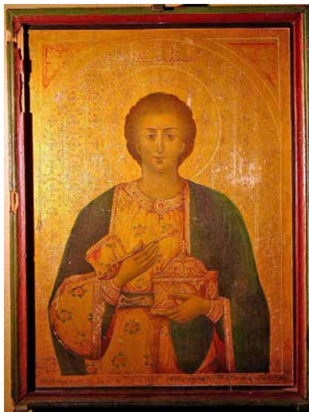
Сл. 1. “Св. Пантелејмон”, икона, 1886 година, автор Никола Теодорус ал Кудси, Ерусалимска сликарска школа, Галерија на икони, катедрален храм „Св. Кирил и Методиј”, Тетово

11 Сосема идентична декорација на драперијата можеме да проследиме во творештвото на познатиот македонски преродбенски зограф Никола Михајлов од Крушево на иконите Исус Христос велик архиереј, 1842 година, катедрален храм Св. Димитрие, Битола и на иконата Исус Христос Цар над царевите, 1870 година, црква св. Преображение Прилеп (в) А. Николовски, Никола Михајлов - Последниот потомок на зографската фамилија на Михаил Зиси , Културно наследство, Републички завод за заштита на спомениците на културата - Скопје, бр. 14/15, Скопје 1987, 22, сл. 1, 27, сл. 7.