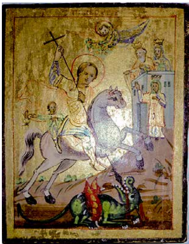
Сл.8. Св.Ѓорѓи, приватна икона на х. Катланови, 1885 г., Скопје, непознати автори, Ерусалимска сликарска школа

Св. Ѓорѓи е еден од најпочитуваните светители во Светата земја и еден од малкуте светители кој во уметноста добил претстави во многубројните епизоди од неговото житие во врска со постхумните чуда што му се припишуваат. Во Источната црква се популарни сцените од неговите миракули: „Св. Ѓорѓи ја убива ламјата“ и „Спасувањето на младото момче од заробеништво“, сл.7. 28 Во мелкитскиот иконопис од втората половина на XIX век, двете иконографии најчесто се споени. Една икона „Св. Ѓорѓи ја убива ламјата и спасува младо момче од заробеништво“ непознат поклоник ја донирал на црквата „Св. Никола“ во Тетово. Иконата е сликана во техника темпера, на гипсен грунд врз штица 29 . Фонот е поделен на два