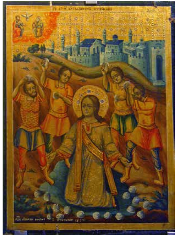
Сл.3. Икона „Каменување на св. апостол и архиѓакон Стефан” од 1877 г. автор Никола Јосиф од Ерусалим

кофаг, во кој е положена плаштеницата како доказ дека воскреснал. На капакот десно од саркофагот седи ангел. Пред саркофагот се четворица војници / стражари, од кои еден спие, двајца се заслепени од силната светлина, а еден се обидува да бега 16 . На левата страна пристигаат мирносици, со садови миро, предводени од св. Богородица 17 . Ликовите се кружни, типизирани со бадемасти очи