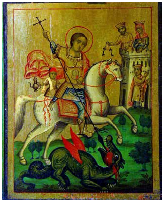
Сл.7. Св. Ѓорѓи, непознат поклоник, Галерија на икони, катедрален храм „Св. Кирил и Методиј“, Тетово, непознати автори, Ерусалимска сликарска школа