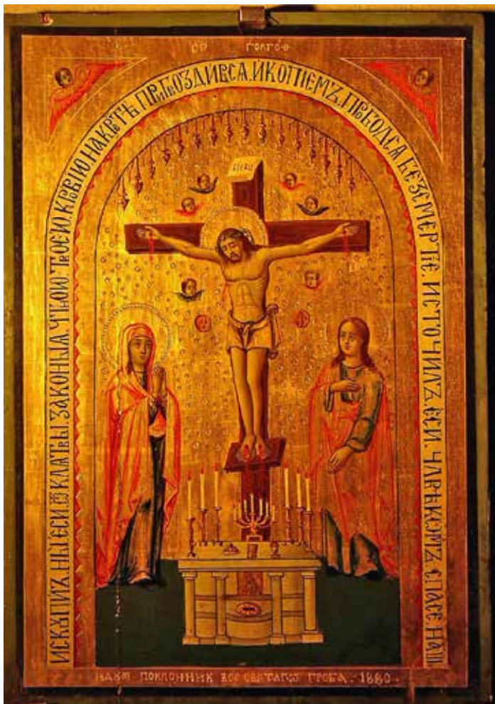
Сл.5. „Св. Голгота” икона на Нако поклоник, 1880 г., автор непознат, Ерусалимска сликарска школа, Галерија на икони, катедрален храм „Св. Кирил и Методиј”, Тетово

ната 21 . Фонот во горниот дел на иконата е златен, касетиран со пунктирање. Зографот Никола Јосиф е типичен претставник на ерусалимскиот стил.