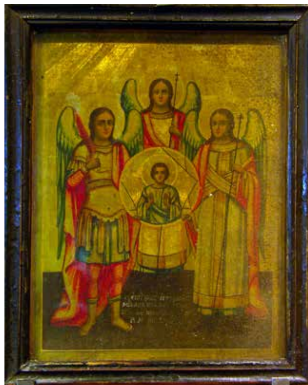
Сл.11. Собир на архангелските сили, икона на поклониците Михаил, Гаврил, Теодор, Р. М. Ануарија, непознат автор, Ерусалим, 1890 г. Галеријата за икони при соборниот храм Св. Кирил и Методиј во Тетово.

допојасно, со ведар лик, голобрад, со куса кадрава коса, облечен во златен хитон, во став на благослов со двете раце. Во драпериите на светите архангели доминираат златна, црвена и зелена боја. Крилјата се зелени. Фонот е двобоен, горе златен, долу зелено-маслинест. Факт е дека оваа византиска иконографија во поствизантиската уметност и во времето на преродбата, главно успеала да ја задржи својата изворна форма и не претрпела некои драстични промени и во Светата земја.