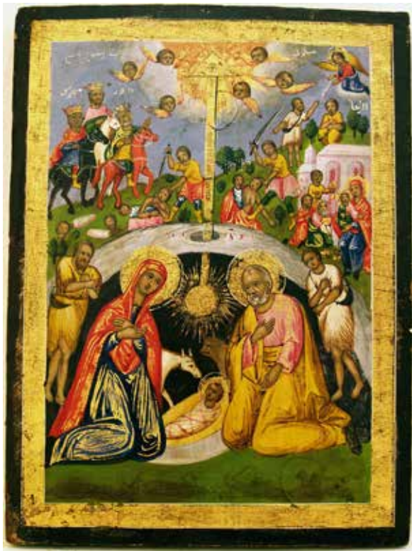
Сл.12. Раѓање Христово, втора пол. на XIX в, автор непознат, Ерусалимска сликарска школа, Галерија на икони, Музеј и завод Охрид

сијата, мудреци, пастири и ангели, колењето на невините вилеамски деца, но не е авторизирана 44 . Над куполата на пештерата грчките сигнатури се испишани со црвена боја. Илустрацијата на ерусалимската икона припаѓа на развиениот тип композиции, која се заснова на евангелските извори (Мат.2, 16-18) 45 . Имено, во преден план, во зелена вегетација се претставени од десната страна св. Богородица, која клечи со вкрстени раце на градите и благо наведната глава над бебето Христос во јасли. Од левата страна клечи св. Јосиф,